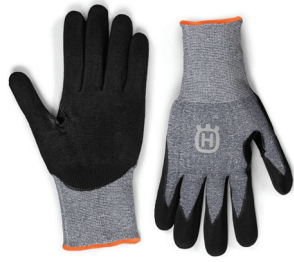
GLOVES, TECHNICAL GRIP 529 88 03-07