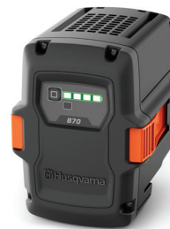
AKKU B70 (75.6 WH) 970 45 71-01