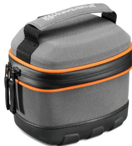
HUSQVARNA AKKUTASCHE 585 37 18-01