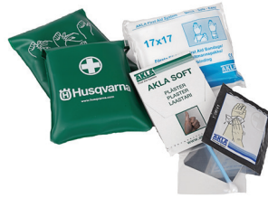
VERBANDSMATERIAL (ERSTE- HILFE-PACKUNG) 504 09 53-01