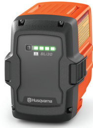
AKKU BLI30 (270 WH) 967 93 77-01