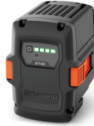
AKKU B140 (146 WH) 970 45 72-01