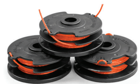
3-PACK SPOOL AND LINE REFILL 534 16 21-01