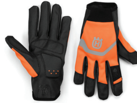
GLOVES, FUNCTIONAL LIGHT NON-SLIP 529 88 02-07