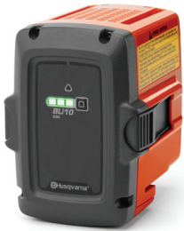
AKKU BL110 (75.6 WH) 967 09 16-01