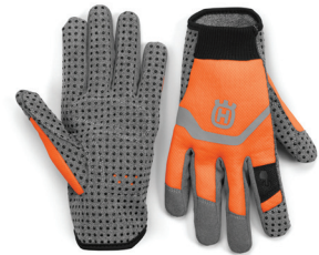
GLOVES, FUNCTIONAL LIGHT VENT 529 88 01-07