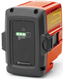
AKKU BLI20 (146 WH) 967 09 17-01