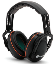
GEHÖRSCHUTZ 505 66 53-04